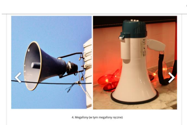
4. Megafony (w tym megafony ręczne)

https://epodreczniki.pl/a/ostrzeganie-i-alarmowanie/Dbgsec6hP